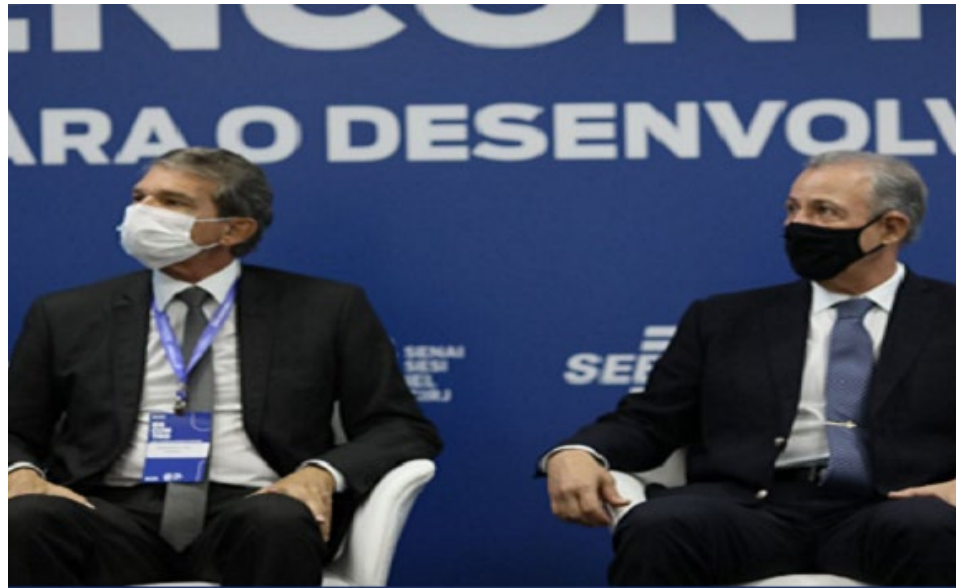
Nosso presidente Silva e Luna participou do evento

O Polo GasLub, que está sendo implantado pela Petrobras na região de Itaboraí e vai receber o gás natural que será produzido no pré-sal, tem potencial para atrair diversos tipos de indústrias que utilizam gás natural no seu processo de produção, gerando empregos, renda, tributos e impostos.