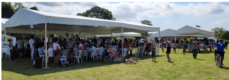
Dia de festa e aprendizado para crianças de comunidades próximas às nossas instalações

A comunidade é uma das quatro por onde passou a caravana solidária da Petrobras, que arrecadou